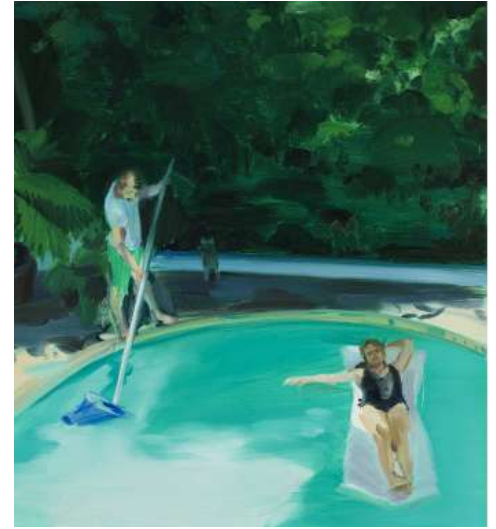
Caroline Walker, Study for Fishing , 2017 Huile sur papier; 53.7 x 47.5 cm © Caroline Walker; Courtesy de l'artiste; GRIMM, Amsterdam/New York/ London et Ingleby Gallery, Edinburgh. Photo: Peter Mallet.

L'exposition s'intéresse à la notion de quête d'ordre chez Didion, proposant une lecture critique et poétique de la piscine en tant qu'icône des sociétés occidentales, tout en mettant en lumière les récits alternatifs qu'elle peut véhiculer – queer, politiques ou liés à la mémoire et au passage du temps. Les artistes présentés dans l'exposition montrent que la piscine est bien plus qu'un simple lieu de loisirs : c'est un espace de réflexion esthétique et sociale, un miroir des aspirations et des angoisses contemporaines.