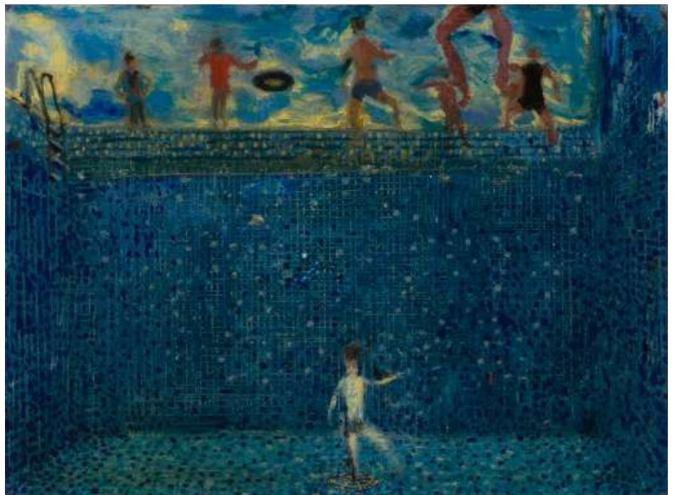
Andrew Cranston, The Sadness of Being Scott , 2016-17 Huile et vernis sur couverture de livre relié, 23.5 x 31.5 cm. Collection privée. Courtesy de l'artiste; Ingleby, Edinburgh; Karma, New York; Modern Art, London. © Andrew Cranston.

Le Locle est une région façonnée par l'eau, ou plutôt par sa disparition. Le nom de la ville provient du mot latin pour lac, lacus . Historiquement, il y avait un petit lac près du Locle : les premières cartes et archives des XVI e et XVII e siècles montrent un plan d'eau ou une zone marécageuse près de la ville, mais l'expansion urbaine et le drainage pour l'horlogerie et le logement l'ont fait disparaître au XVIII e et XIX e siècles. Aujourd'hui, les grandes piscines publiques en plein air du Locle tentent de compenser cette perte. Ce contexte – et la question plus large de la crise mondiale de l'eau – a été au cœur de l'élaboration de l'exposition. Il en va de même pour un ouï-dire à la fois amusant et troublant de l'histoire récente du MBAL : une proposition, évoquée par certain·ne·x·s politicien·ne·x·s, de fermer le musée et de le remplacer par une piscine couverte. Heureusement pour le patrimoine artistique et culturel du Locle, du canton de Neuchâtel et plus largement de la Suisse, ce projet n'a pas abouti, et, dans le cadre de cette exposition, la menace – et les idées qui y sont associées, concernant le pouvoir, l'ambition et la modernité – se transforme en thème principal.