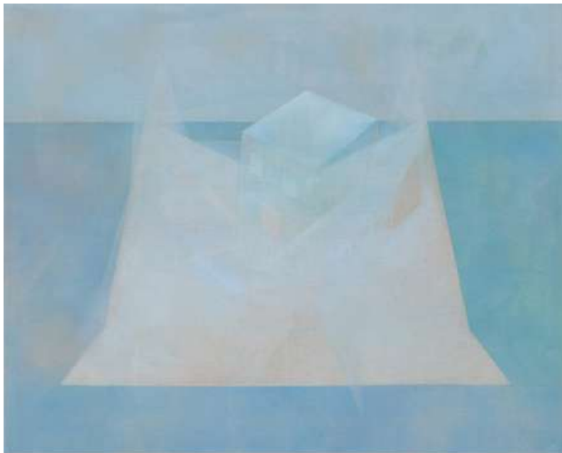
Mary Stephenson, New House (détail), 2025 Huile sur toile de lin, 160 x 200 cm Estrade, 300 x 30 x 200 Collection privée, Monaco.

Un livre d'artiste unique et imperméable, que l'on peut lire dans l'eau — à l'instar des livres de bain pour enfants —, constituera à la fois une œuvre exposée et un souvenir de l'exposition. Cette approche originale, qui remplace le catalogue d'exposition traditionnel, présentera les œuvres de la peintre londonienne Mary Stephenson , dont la palette subtilement nuancée oscille