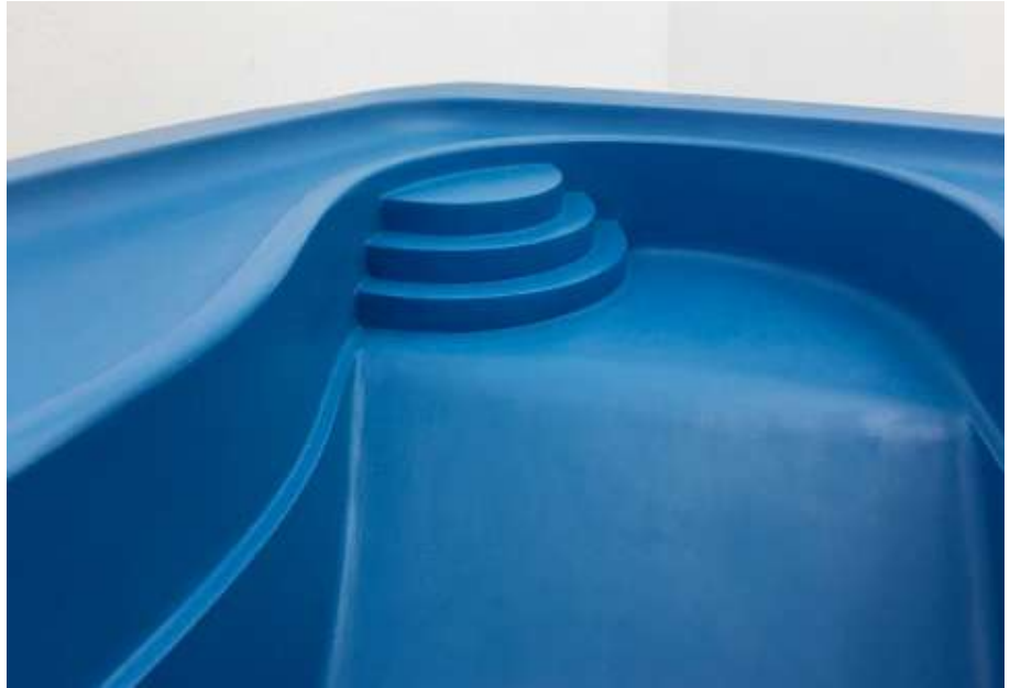
Daina Mattis, Lap Pool (Cobalt) , 2018 Fibre de verre et acier. 41cm x 52cm x 63,5cm © Daina Mattis. Courtesy de l'artiste et de la High Noon Gallery.