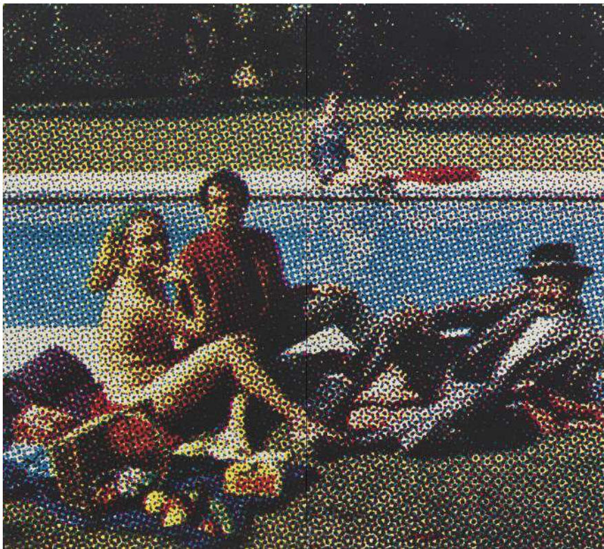
Alain Jacquet, Le Déjeuner sur l'herbe , 1964 Diptyque, sérigraphie en quatre couleurs sur papier monté sur toile, 175 x 195 cm. ©Alain Jacquet / ADAGP, Paris, 2026. Courtesy d'Alain Jacquet Estate et Perrotin.

Cette exposition explore la piscine en tant que motif significatif dans l'histoire de l'art contemporain. Elle réunit des artistes qui ont interrogé la complexité de la piscine, l'utilisant comme symbole à la fois de prospérité et de catastrophe, de joie et de solitude : une métaphore de notre quête d'ordre et de sérénité face à un avenir de plus en plus incertain.