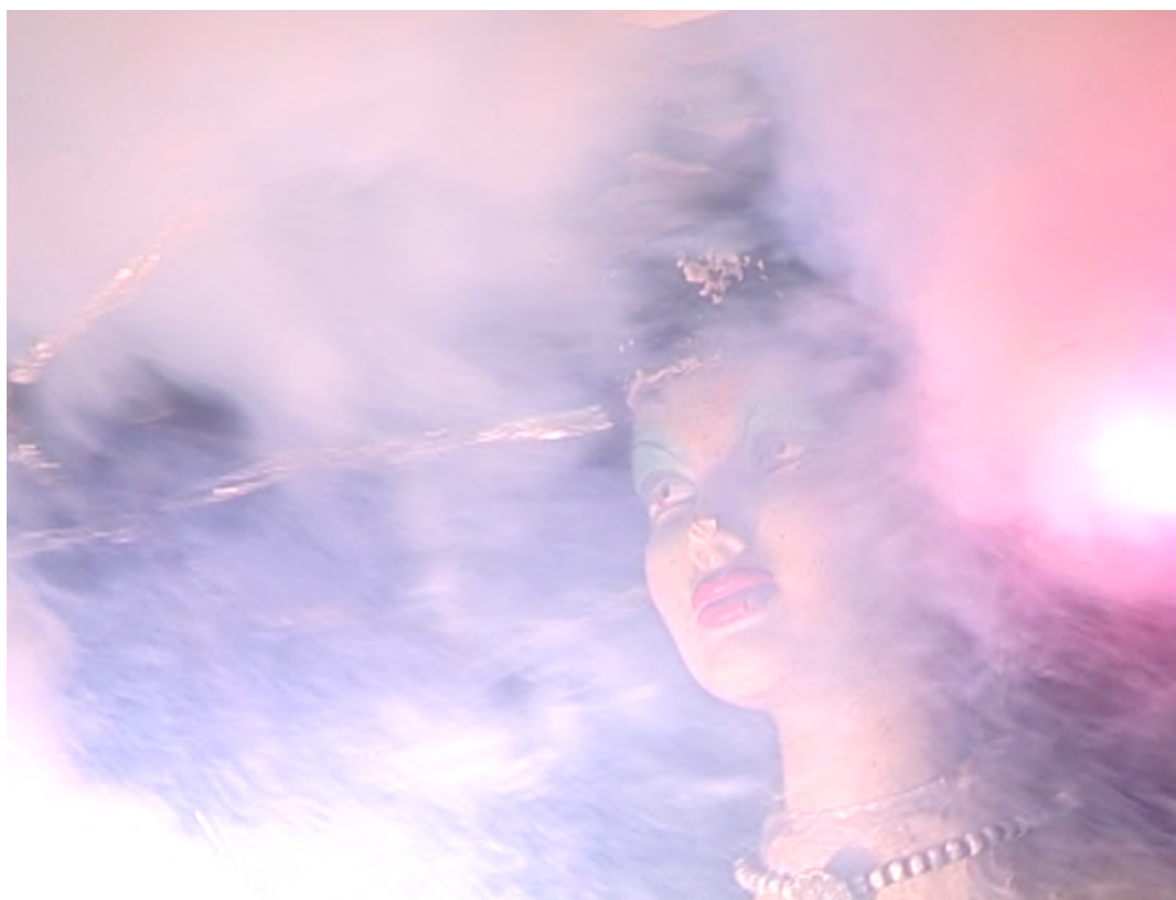
Ingeborg Lüscher, La Pupa Proibita , 2006, capture vidéo. © Ingeborg Lüscher / videoart.ch