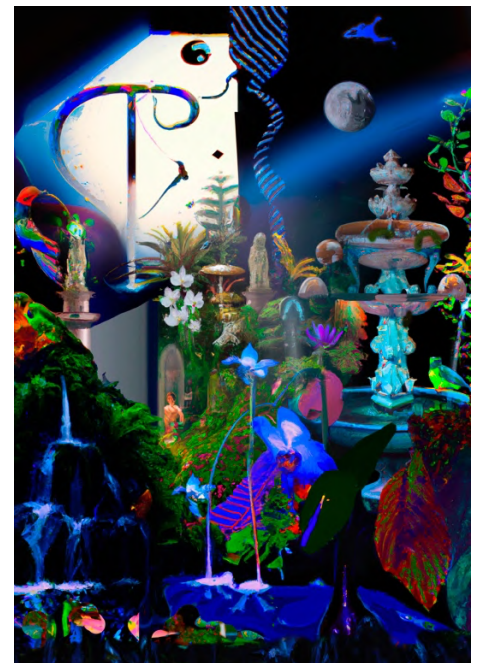
(gauche) Marco Useli, Elisarion, il chiaro mondo dei beati , 1\20 série de Gurudeva, 2023. Mix média et pâte d'argent sur papier coton noir, aquaforte et techniques de monotypie. Courtesy : Marco Useli. (droite) Maria Guta & Lauren Huret, croquis préparatoire pour The Eternal Youth Program series , 2024. Peinture, impression sur toile, pastel à l'huile, 90 x 130 cm. Courtesy : Maria Guta & Lauren Huret