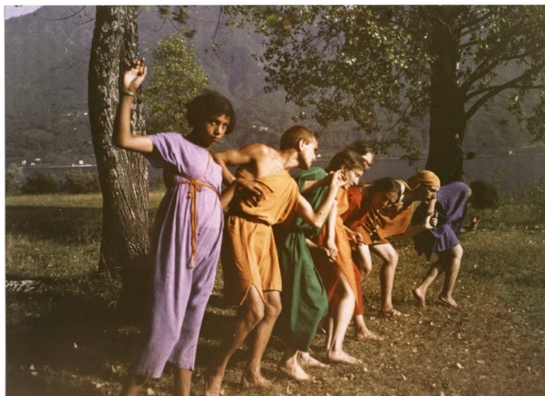
Photographie de groupe avec Mary Wigman.