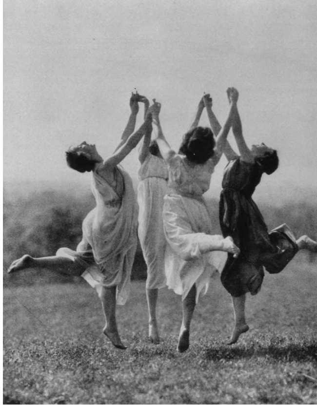
Groupe de danseuses à Monte Verità.

Parution en mars 2024 du livre Les voix magnétiques sur les figures féminines qui vécurent à Monte Verità, ainsi que d'une collection d'images, sous la direction de Federica Chiocchetti et Nicoletta Mongini.