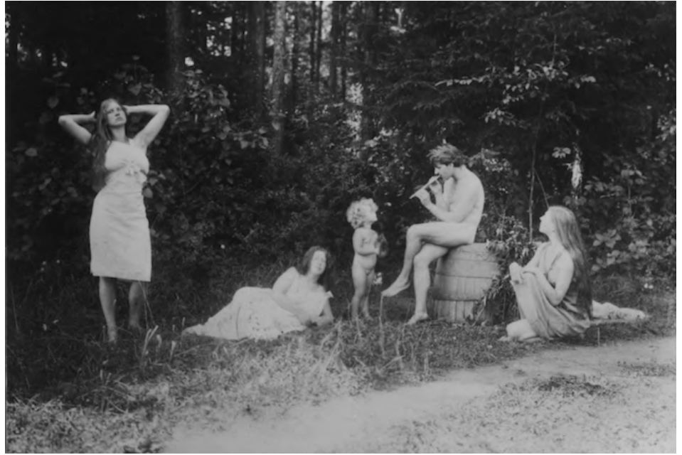
Photographie des invité·e·x·s du sanatorium.