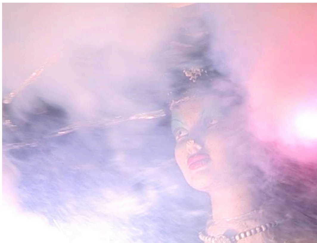
Ingeborg Lüscher, La Pupa Proibita , 2006. Video. Screen shot.