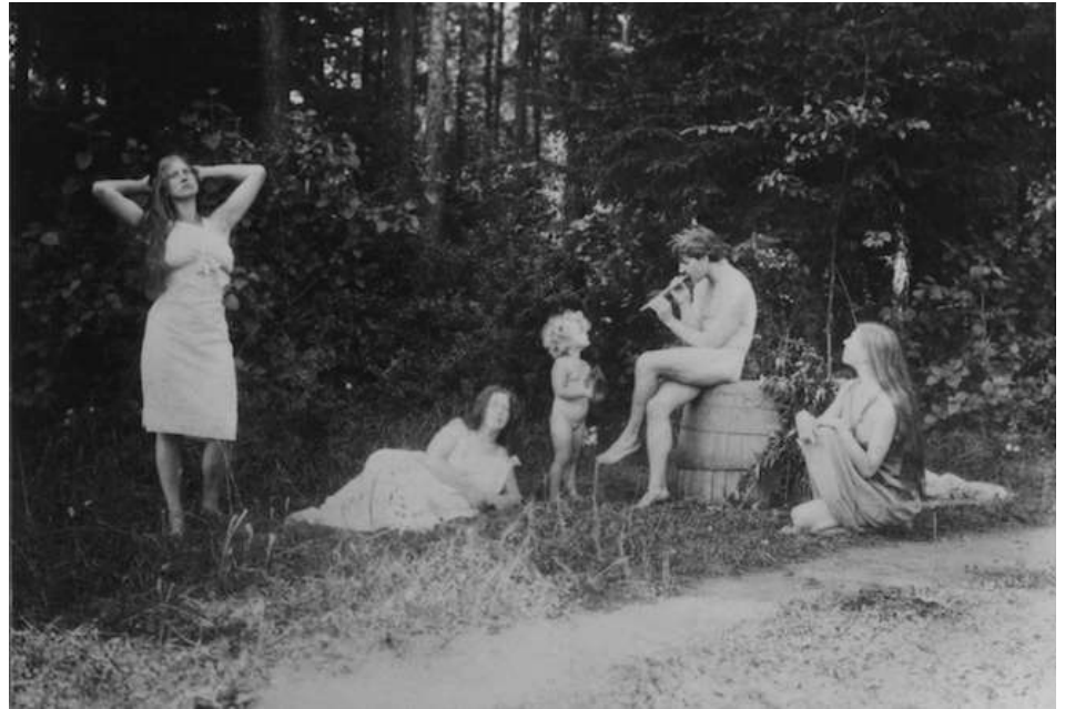
Photographie des invités du sanatorium.