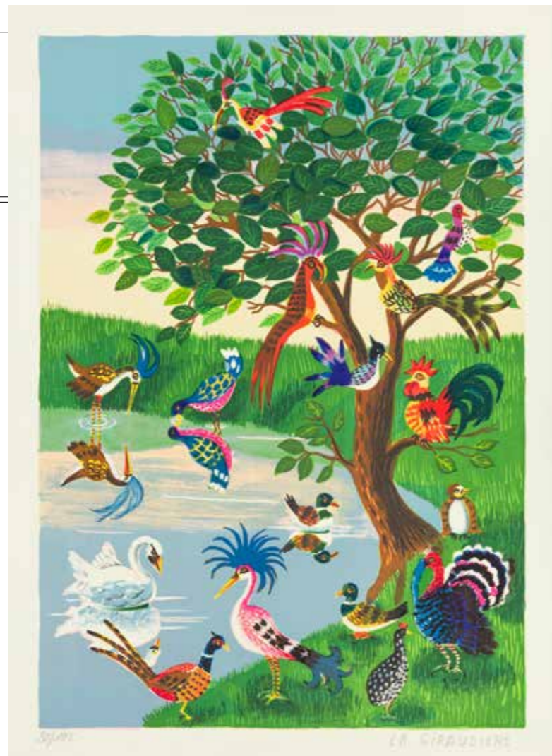
Oiseaux au bord de l'étang, par Mady de La Giraudière, artiste peintre art naïf.

«Hackney Diamonds», sortie le 20 octobre, Jewel Case