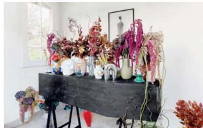
Une chambre funéraire à l'opulence baroque décalée. PRUNE SIMON-VERMOT