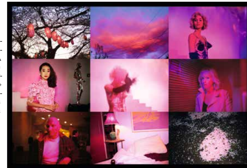
NAN GOLDIN «Pink Grid», 2016. Cibachrome marouflé sur dibond, 150 x 219 cm. Edition de 3.