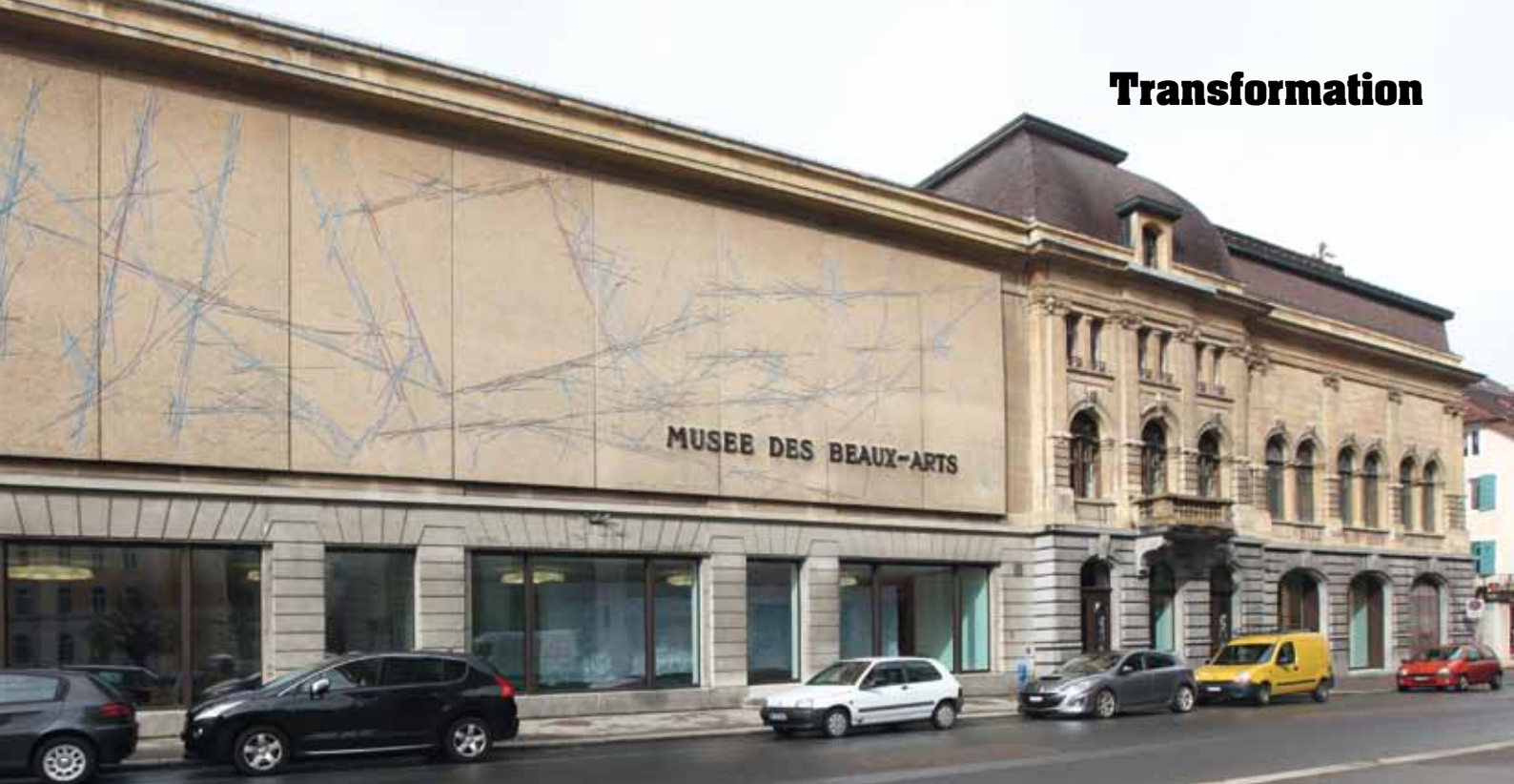
MUSÉE, LE LOCLE